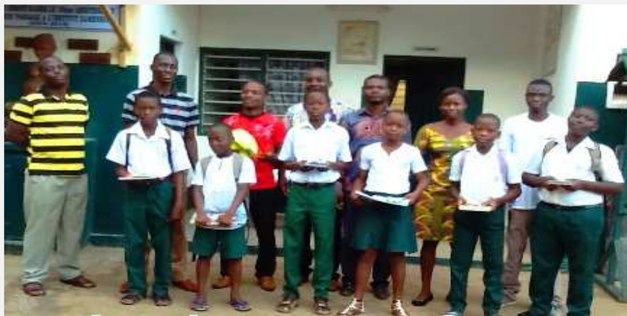
Les lauréats du jeu-concours