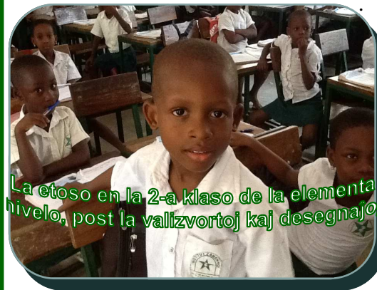
La etoso en la 2-a klaso de la elementa nivelo, post la valizvortoj kaj desegnaĵoj

La senkompara entuziasmo ĉe la fino de la laborgrupoj ĉirkaŭ la 12-a kaj 15 minutoj konfirmis la sukceson plenan de la tuta aranĝo.