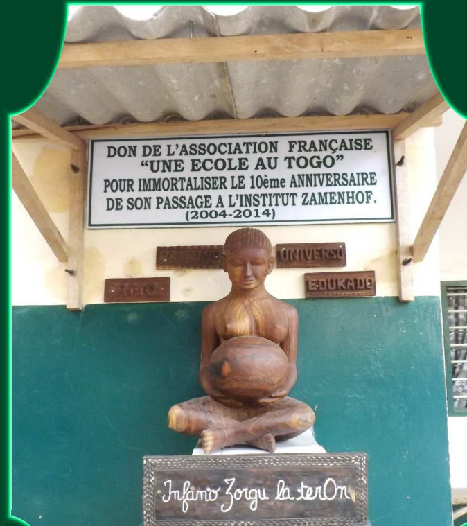
Bienvenue à l'Institut Zamenhof