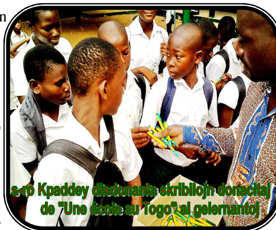
s-ro Kpaddey distonantis skribilojn donacitaj de "Une école au Togo" al gelernantoj

Estis la 14-a horo kaj duono, kaj ĉiuj gelernantoj, plenkreskuloj de la alfabetiga kurso kaj niaj gastoj plenigis la subtegmenton de la lernejo por la kultura vespero. Vidu la foton suban.