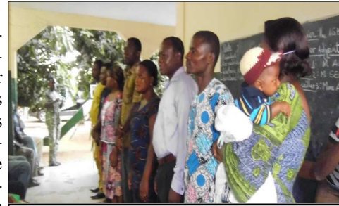
Le nouveau bureau des parents d'élèves