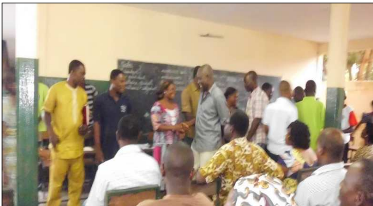
Le corps enseignant en train de saluer le nouveau bureau des parents d'élèves