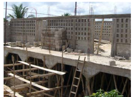
Etat actuel de la construction

Voilà qui est bien, mais pour l'instant, il ne s'agit que des cours élémentaires et secondaires.