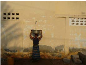
virino aĉetanta akvon

"Samkvartalanoj ege ghe- nas min, ke mi chiel klopodu, ke dua lernejo ZAMENHOF kun licea nive- lo estu konstruita en la kvartalo. Chiuĵ diras, ke ni tre bone zorgas pri la unua lernejo, ke la rezultoj chiam estas bonaj, kaj tial ili chiu- tage turnighas al mi", rakontis la vicprezidanto de la asocio de gepa- troj de gelernantoj de Instituto Zamenhof. Chu vere estas tiel ?