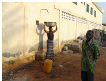
Une femme achète de l'eau. Le gardien s'occupe de la vente.

Il faut se trouver à Izo le 10 septembre 2007 pour ressentir le mécontentement des parents. Ils ne comprennent absolument pas pourquoi on n'accepte pas tout le monde dans l'école privée d'Izo. Or, ceci se révèle impossible, car il y a plus de demande que de place.