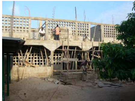
Nuna stato de la konstruado

Tio estas bona, sed nun nur pri la elementa kaj duagrada nive- loj temas.