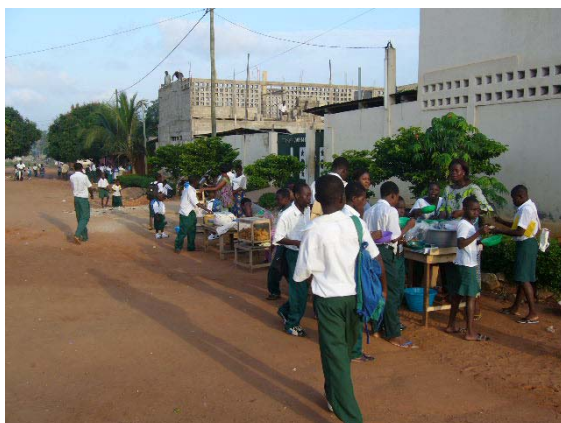
Vendeuses et élèves

Les responsables de l'Institut Zamenhof remercient « Une Ecole au Togo » en France, « Een School » aux Pays-Bas ainsi que tous les autres participants.