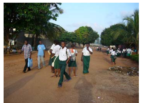
Les élèves se rendent à l'école

L'année scolaire a effectivement commencé le 17 octobre 2007. Bien que les classes supplémentaires ne soient pas encore prêtes, la sixième classe du niveau élémentaire a été ouverte.