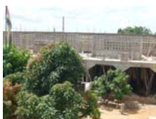
foto pri konstrula- borejo

Necesas esti en IZO la 10- an de septembro 2007 por sperti mem la grumblojn de gepatroj. Ili tute ne komprenas, kial en la lerne- jo IZO privata oni ne akceptas chiujn. Tio estas ne ebla, ĉar es- tas pli da petantoj ol da lokoj.