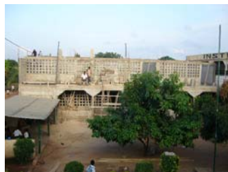
Photo de la construction

Il faut se trouver à Izo le 10 septembre 2007 pour ressentir le mécontentement des parents. Ils ne comprennent absolument pas pourquoi on n'accepte pas tout le monde dans l'école privée d'Izo. Or, ceci se révèle impossible, car il y a plus de demande que de place.