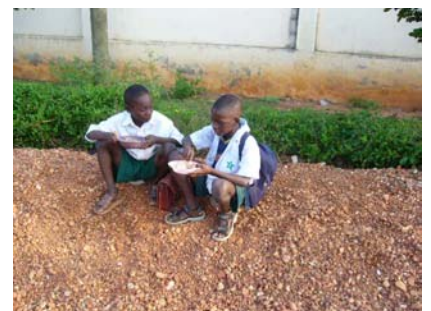
Du lernantoj sidas sur gruzo manghantaj

Pri lernometodoj nenio shanghighas. Ĉio ekiris kiel en la antaŭa jaro. Tamen decas noti, ke pli spertas la geinstruistoj, kaj tio vere plibonigos la rezultojn. IZO- gvidantoj ĉirkauigis gelernantojn kaj geinstruistojn per apartaj zorgoj, ke la instrulaboroj okazas en bonaj kondiĉoj.