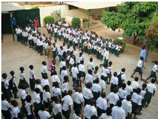
Ils se dirigent vers les classes

Sixième : 59 élèves Cinquième : 49 Quatrième : 48 Troisième : 31 Ce sont donc 360 élèves qui étudient à Izo en ce début d'année.