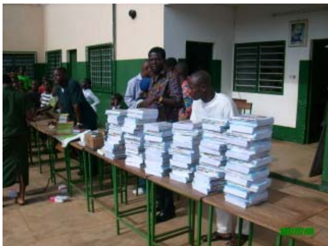
La premioj disdonotaj Les prix distribués