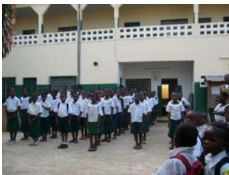
Gelernantoj salutas la flagon togolandan

La 17-an de oktobro 2007 komencighis la nova lerneja jaro, kaj en la sama tago seriozaj instru-laboroj ekis en IZO. Tiel plu ili iros ghis la fino de la jaro, ke kaj gelernantoj kaj geinstruistoj estu kontentaj pri la rezultoj.