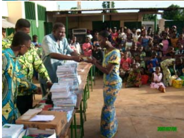
Gelernantoj kun premioj Les étudiants avec leurs prix